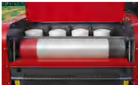
Отделение для бобин (сетка-нить)