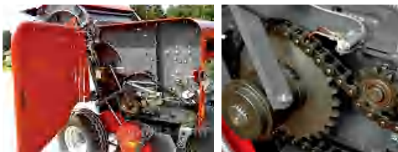
Автоматическая система смазки цепей

Установленная в пресс-подборщике Entry АВТОМАТИЧЕСКАЯ СИСТЕМА СМАЗКИ позволяет в течение всего рабочего цикла пресс-подборщика смазывать основные рабочие узлы машины. При необходимости смазку можно нанести на цепь полностью в ручном режиме. Важно, что при этом полностью исключается загрязнение продукта смазочными маслами.